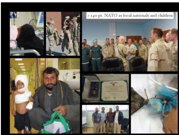
> 140 pt. NATO as local nationals and children